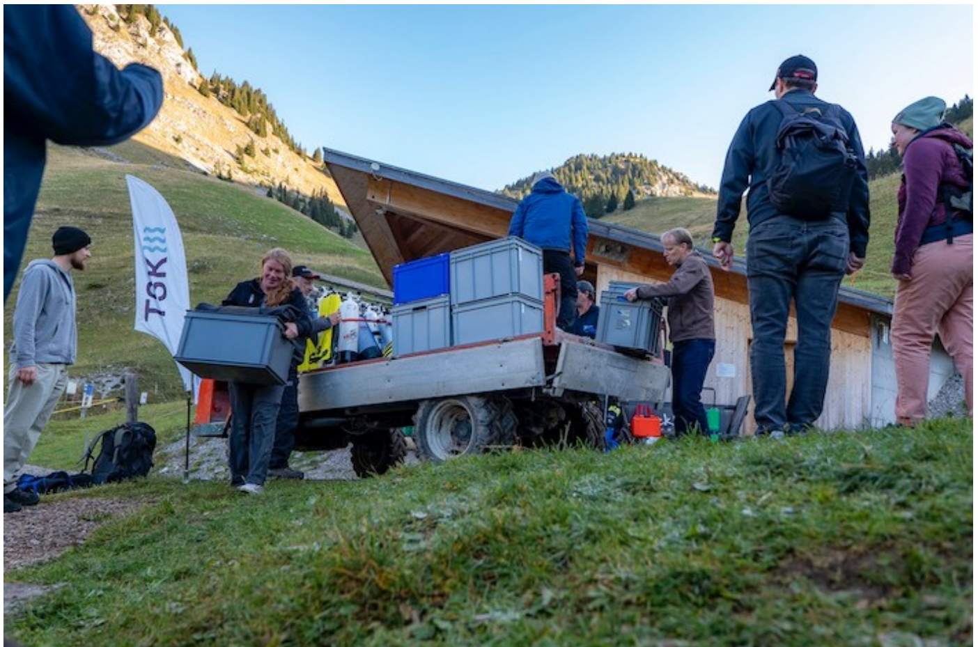
Die Helferinnen und Helfer beim Entladen des Materials für den Putztag.

Es wird ein wenig eng. Doch wo ein Wille ist, da ist ein Weg. Nach wenigen Minuten Fahrt und einem ersten Vorgeschmack auf das eindrückliche Bergpanorama erreicht die Luftseilbahn die Mittelstation Chrindi. Eine Passagierin, die an Höhenangst leidet, scheint heilfroh zu sein, endlich wieder festen Boden unter den Füßen zu haben. Während sich die Gäste, teilweise mit weichen Knien, langsam verteilen, hieven die Helfenden des Putztages zahlreiche Kisten aus der Gondel.