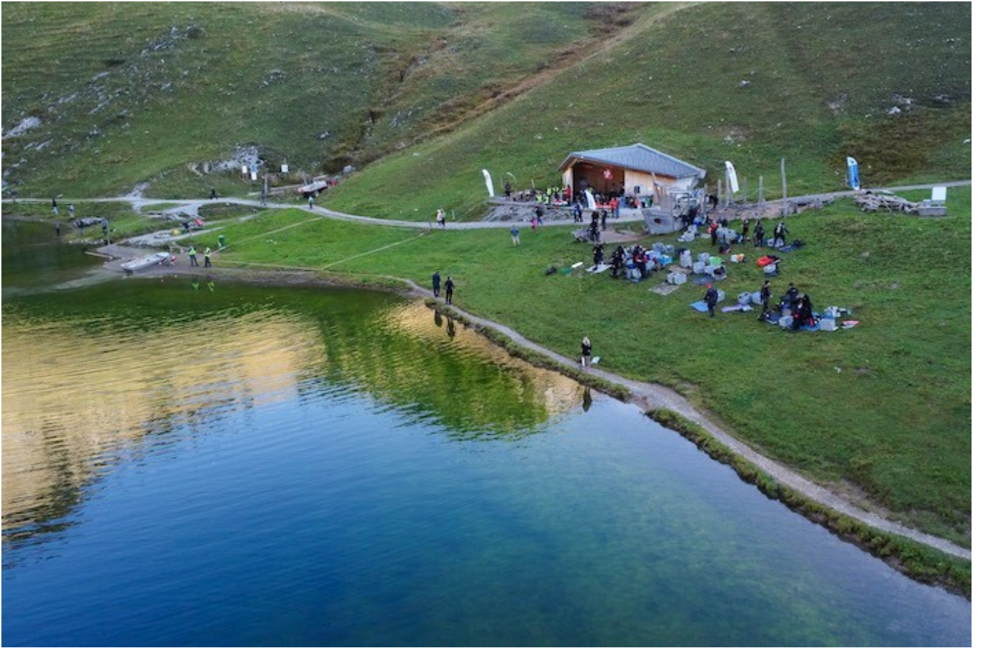
Das Basislager am Bergsee, auch im Bild, der abgesperrte Bereich für den Heli – für den Fall der Fälle.