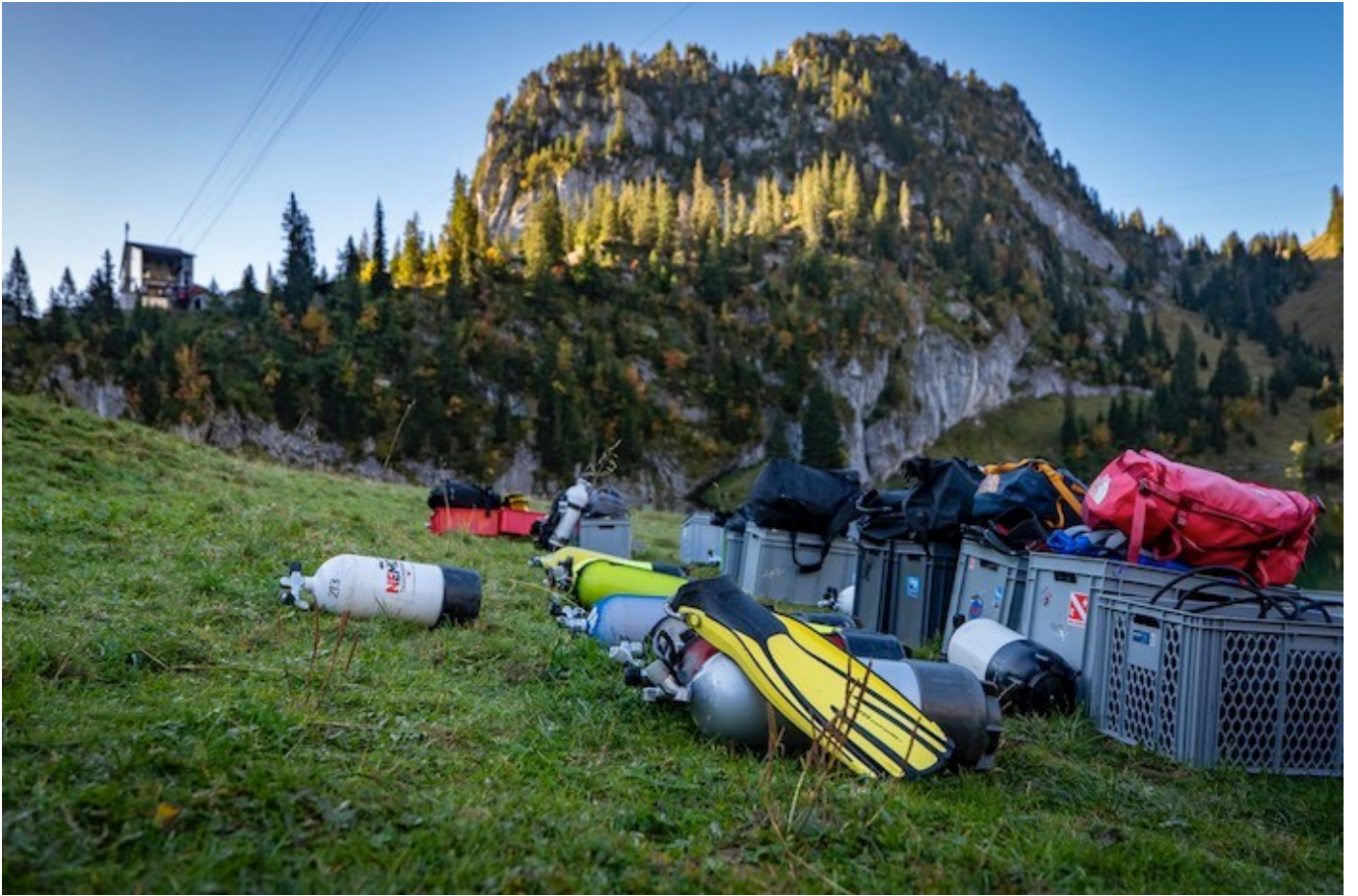
Zahlreiche Pressluftflaschen oder auch Flossen mussten mit der Seilbahn zum Bergsee befördert werden.