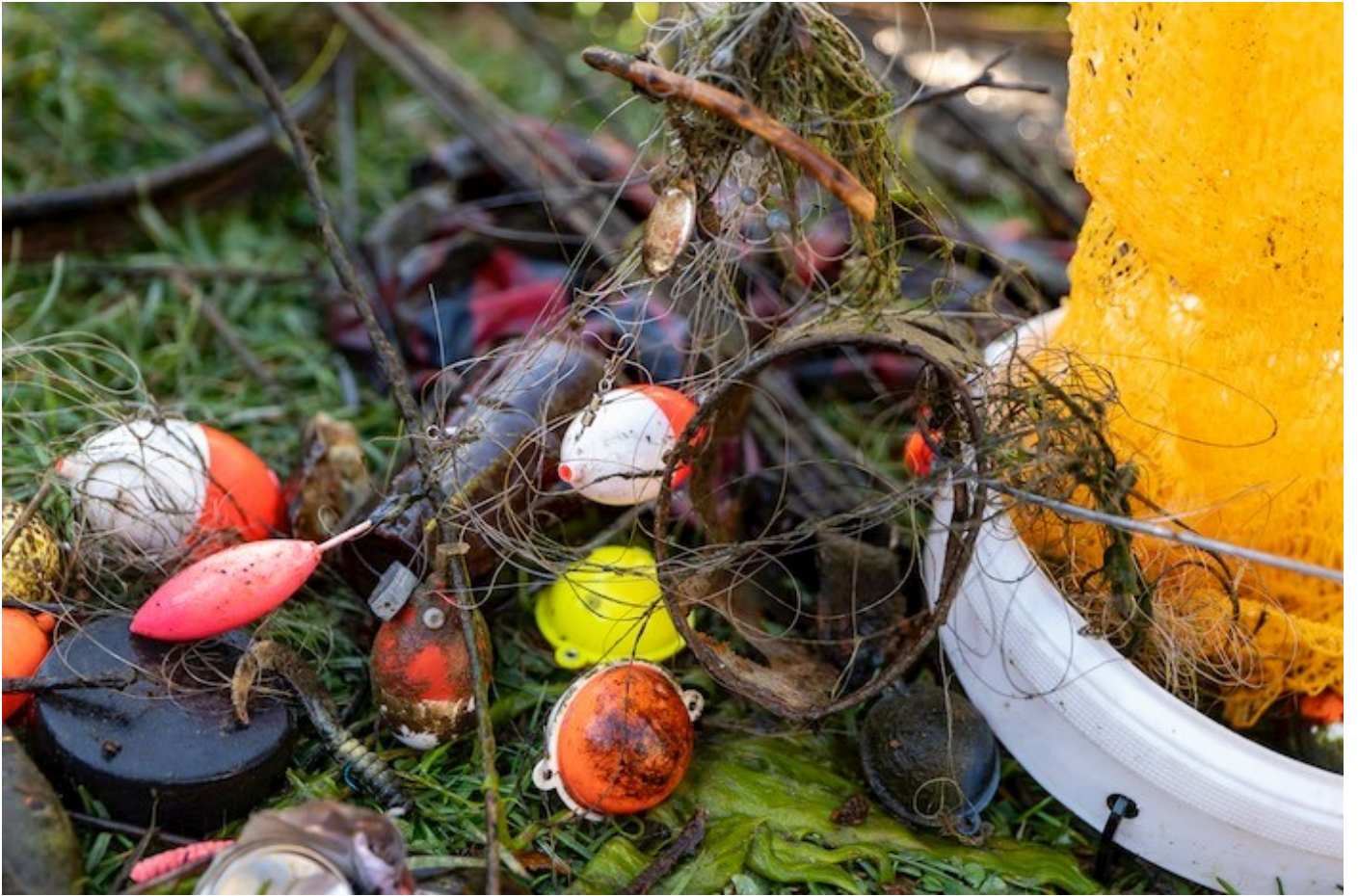
Vor allem Fischereimaterial wurde im Hintersockensee gefunden.