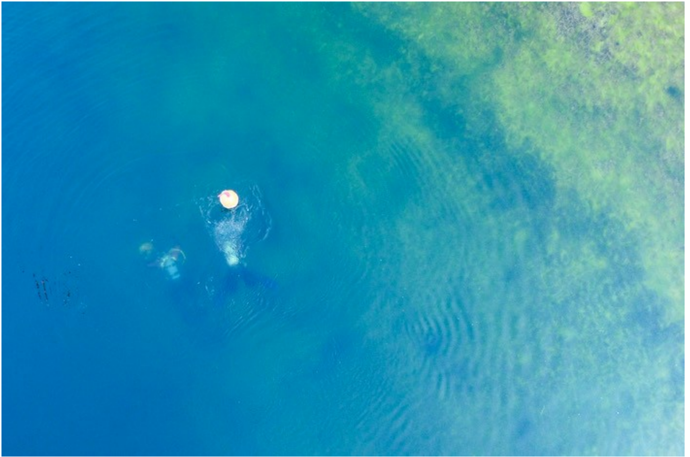
Der Hinterstockensee erreicht eine Tiefe von bis zu 18 Metern.