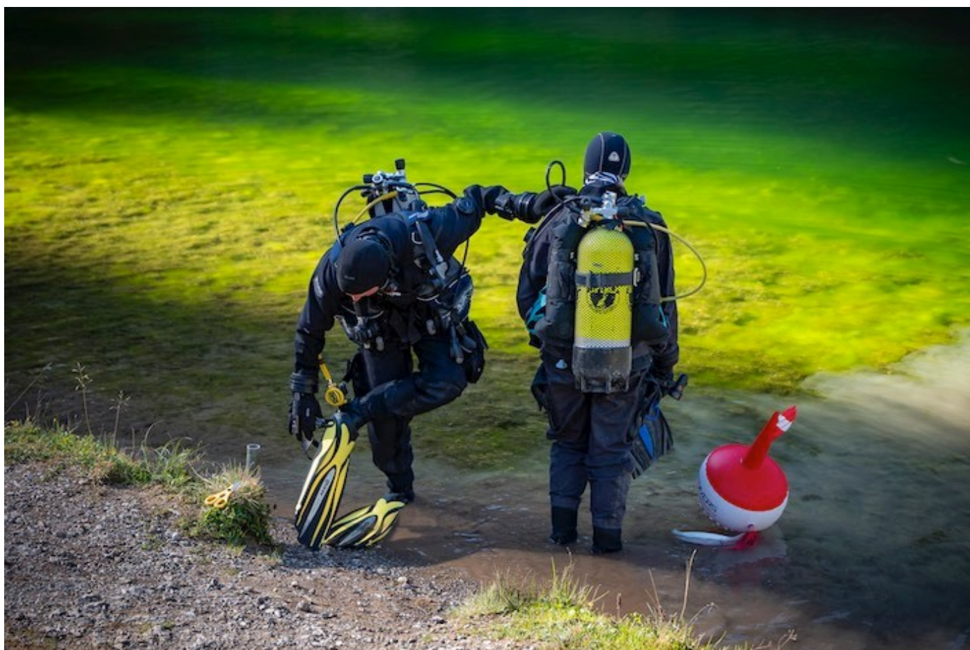
Zwei Taucher machen sich bereit für ihren Einsatz Unterwasser.

Auch auf Initiative des Oberländer Fischereivereins «Highland Fishing», in enger Zusammenarbeit mit dem schweizerischen Unterwasser-Sport-Verband (SUSV), werden jedes Jahr Bergseen im Berner Oberland von Abfall befreit. Nun war das türkisblaue Gewässer auf 1595 Metern über Meer in der Gemeinde Erlenbach an der Reihe, sich schrubben zu lassen. Die «Schätze», welche die Taucherinnen und Taucher fanden, sind teilweise etwas kurios.